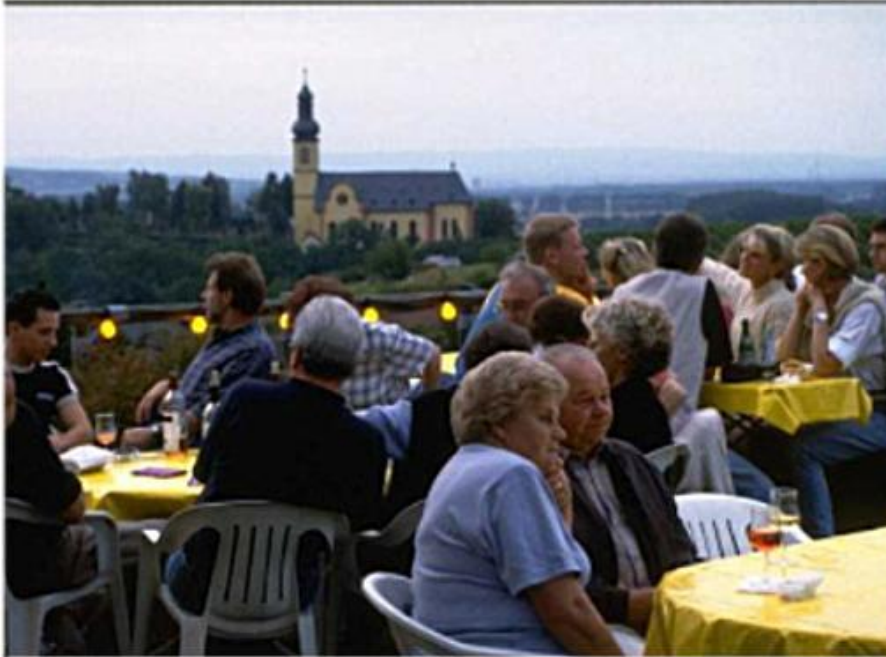
Gemütliche Stunden bei einem guten Glas Wein