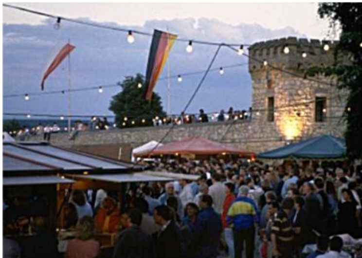
St.-Albans-Fest in Bodenheim